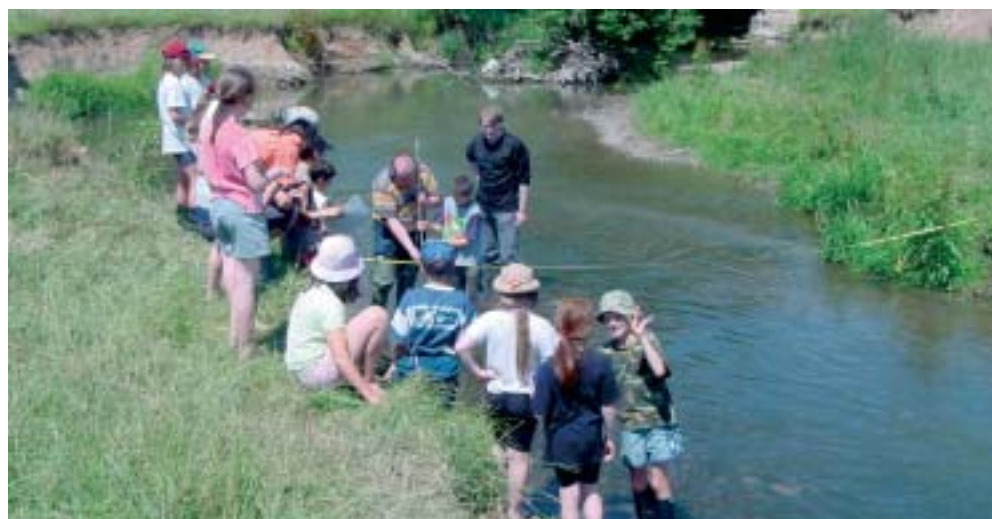
Les techniciens des Services Gestion de l'Eau montraient comment mesurer le débit de l'Attert. Unter Anleitung der Mitarbeiter des Wasserwirtschaftsamtes wurde die Fließgeschwindigkeit der Attert gemessen.

D'autres activités traitaient les oiseaux au bord de l'eau ou bien attiraient l'attention sur l'eau "cachée" dans l'atmosphère et le corps des êtres vivants. Elèves et instituteurs ont également eu la possibilité de découvrir les jeux et activités de la "malle pédagog'eau". Cet outil a été réalisé par la Fondation Oeko-fonds pour permettre aux enfants de s'appropriier l'élément eau dans une relation de plaisir. En plus, les techniciens du syndicat des eaux résiduaires SIDERO étaient sur place pour donner de nombreux renseignements sur les eaux usées.