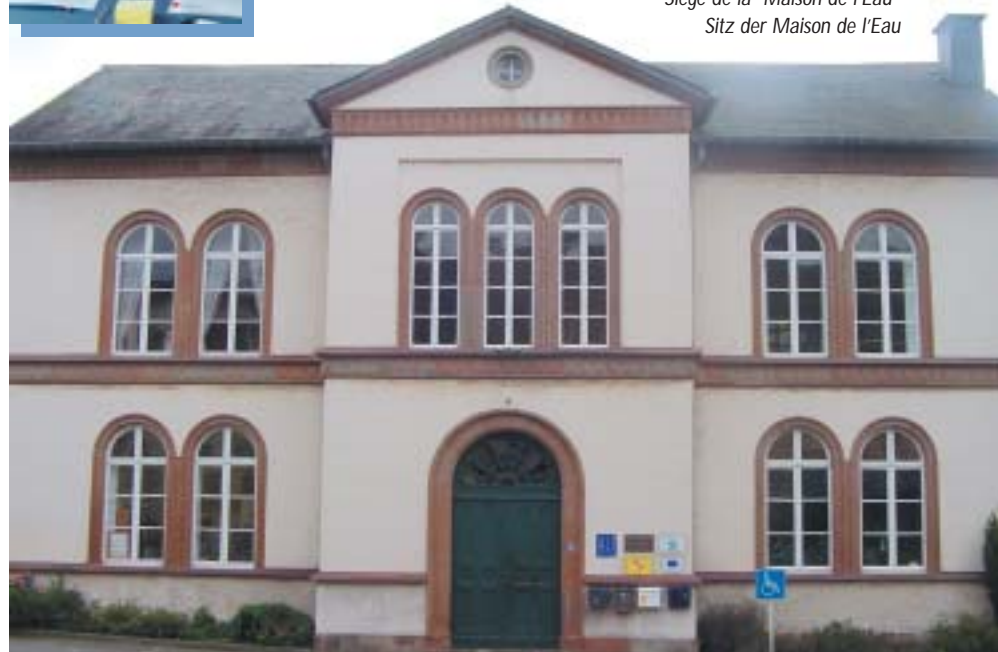
Siège de la "Maison de l'Eau" Sitz der Maison de l'Eau

L'étude qui sera réalisée grâce aux financements des Services Gestion de l'Eau du Ministère de l'Intérieur constitue un document pratique pour la mise en place de zones de protection de berges dans le bassin versant de l'Attert.