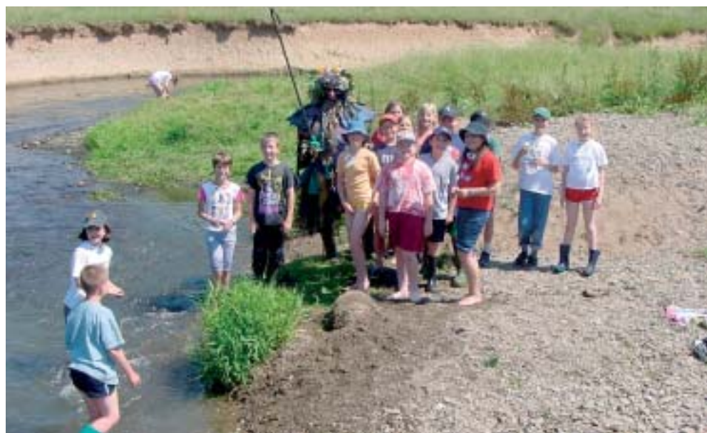
Le "Kropemann" était également en visite...